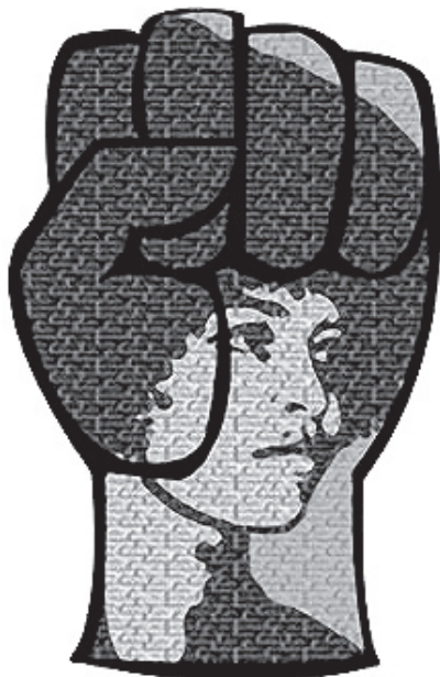
Angela Davis, verdadero ejemplo de feminismo revolucionario.

¿Qué nos espera para el 2012? Un largo camino por recorrer y mucho trabajo. Invitamos a todas y a todos, trabajadoras y trabajadores, a participar de estos procesos y luchar en pro de la emancipación de la mujer trabajadora y en contra de capitalismo patriarcal.